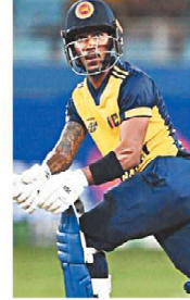
और कुसल परेरा से एक ज्यादा है। टी20 अंतरराष्ट्रीय मैचों में श्रीलंका के लिए सर्वाधिक 50 से ज्यादा रन

नई दिल्ली, एजेंसी। श्रीलंका के पथुम निस्सांका ने मौजूदा पुरुष टी20 एशिया कप 2025 में लगातार दूसरे अर्धशतक (68 रन) के बाद 150 रनों के लक्ष्य का पीछा करते हुए हांगकांग के खिलाफ अपनी टीम को जीत दिला दी। इसी के साथ ही निस्सांका ने कुसल मोंडिस और कुसल परेरा जैसे बड़े श्रीलंकाई खिलाड़ियों के टी20 अंतरराष्ट्रीय मैचों में श्रीलंका के लिए सर्वाधिक 50 से ज्यादा रनों के रिकॉर्ड को तोड़ दिया है। निस्सांका ने छोटे अंतरराष्ट्रीय प्रारूप में अपनी शानदार फॉर्म जारी रखी और पिछले 5 मैचों में अपना तीसरा और मौजूदा एशिया कप में दूसरा अर्धशतक जड़ा। 27 वर्षीय निस्सांका ने अपने 4 साल से कम के करियर में ही टी20 अंतरराष्ट्रीय मैचों में श्रीलंका के लिए सबसे ज्यादा 50 प्लेयर रन का रिकॉर्ड बना लिया है। निस्सांका ने उगी तक कोई टी20 अंतरराष्ट्रीय शतक नहीं लगाया है। निस्सांका ने श्रीलंका के लिए टी20 अंतरराष्ट्रीय मैचों में 17 बार पचास से ज्यादा रन बनाए हैं, जो इस प्रारूप में श्रीलंका के अनुभवही खिलाड़ी कुसल मोंडिस